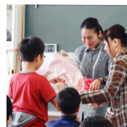
↑ 小学校教員を辞める際 花束をいただきました

大学卒業後、新卒で株式会社リクルートに入社。社会人3年目を終えるタイミングで、どうしても教育への思いを捨てることができず、NPO法人を通じて、福岡県飯塚市に小学校教師として赴任。 担任として、子どもたちと関わり、NHK『人生デザインU-29』の番組で取り上げられた。 教育者としての任期満了後、人材育成のプロフェッショナルが集うベンチャー企業に身を置き、企業の人材開発を通じて人や組織の可能性を最大化させるサポートを行った。