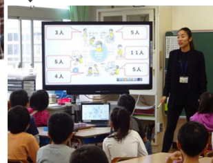
電子黒板を用いての授業 様々なチャレンジを行いながら学校教育を行っておりました